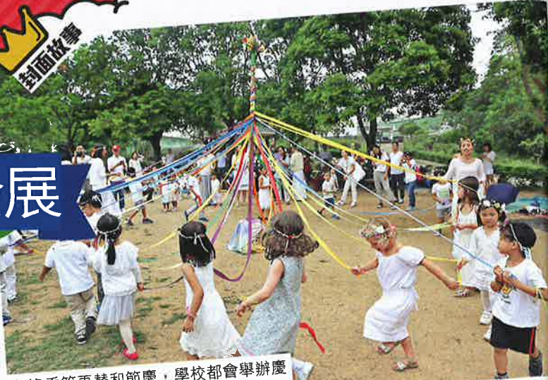
每逢季節更替和節慶，學校都會舉辦慶祝活動，讓孩子感受大自然的變化。