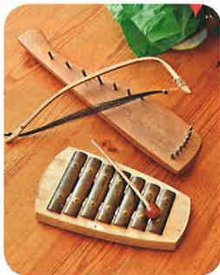
上音樂課會彈奏天然材料製作的樂器，有些是海外華德福教師所設計的，亦會清唱，但不會播音樂，因為是機械發聲。

環境對學生亦很重要，課室全以粉色為主。「採用暖色是因為用色能影響小朋友的感官，而暖色系給幼兒有安全感。我們亦會保持室內溫暖，因身體溫暖對思維很重要，吸收能力亦會好些。」學校使用的物料採全天然的木材、籐、羊毛和布料等，沒有塑膠，因塑膠表面太平滑，無法刺激孩子的觸覺神經。「相反，有質感的物料能刺激孩子的感官，有助腦部發展。採用最天然的材料，亦不怕小朋友敏感。」另外，學生吃的都是自家製的有機食物，絕無人造色素和人造糖，因為這些都對孩子的健康有影響。