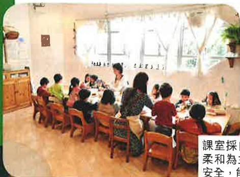
課室採自然光。用色亦以溫暖柔和為主，因暖色系讓幼兒感安全，能提升學習能力。

他們亦鼓勵幼兒有創意地自由玩耍，學校的時間表又確實有很多玩樂時間。「我們稱這為『free play (自由玩樂)』。因華德福教育相信玩耍最適合幼兒的學習需要，其次是幼兒玩耍時大人不應干預，讓他們隨意地 (free) 玩，這樣才會發揮創意和想像，並發展孩子的主動性，培養出他們的好奇心，對事物產生的興趣。」但自由地玩耍並非沒規矩，也會有 tidy up time (收拾時間) 要他們收拾玩具、定時作息及守紀律等。