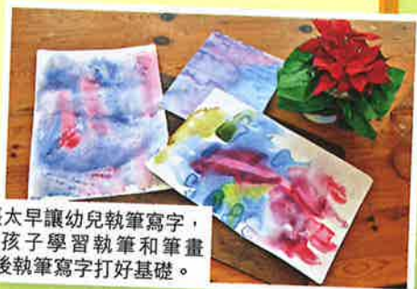
華德福教育不主張太早讓幼兒執筆寫字，但會在畫畫時讓孩子學習執筆和筆畫 (stroke)，以為日後執筆寫字打好基礎。

現時，全港只有兩所私人開辦並在教育局註冊的華德福幼稚園，一所位於半山的Highgate House；另一所位於西貢的Garden House。而在港註冊的華德福小學亦有兩所，分別位於西貢和堅尼地城。不少華德福幼教學生會升讀本地國際學校，或往海外升學。