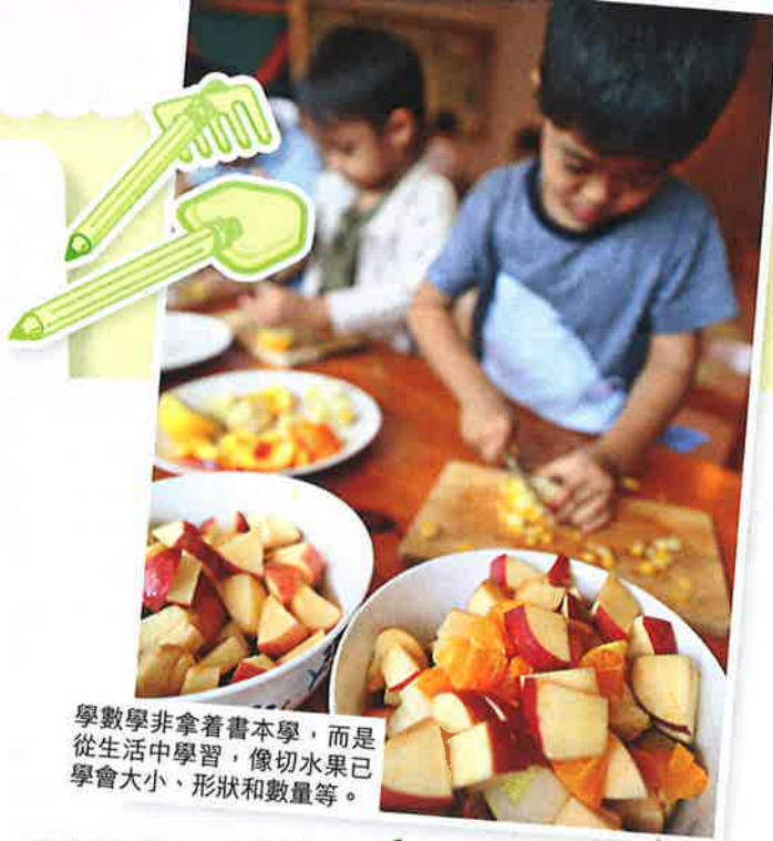
學數學非拿着書本學，而是從生活中學習，像切水果已學會大小、形狀和數量等。