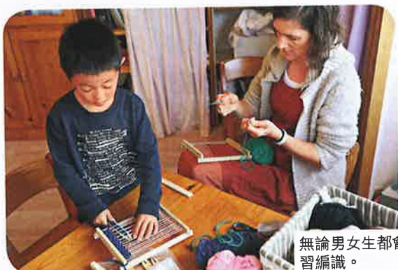
無論男女生都會學習編織。

「華德福教育 (Waldorf Education)」由奧地利哲學家兼科學家Rudolf Steiner所創立。第一次世界大戰時，名為Waldorf的煙草公司欲在廠房內開辦學校給員工子女，方便他們在動盪日子能安全上學，亦讓員工可安心工作，於是請來Steiner幫忙。第一所華德福學校成立後，該教育系統便以該公司命名。